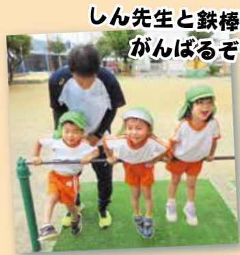
しん先生と鉄棒 がんばるぞ!