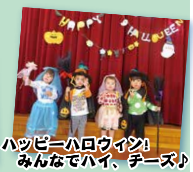
ハッピーハロウィン! みんなでハイ、チーズ♪

発行・社会福祉法人 高知慈善協会 高知市布師田一七二番地(電話 〇八八―八四六―五五四六)