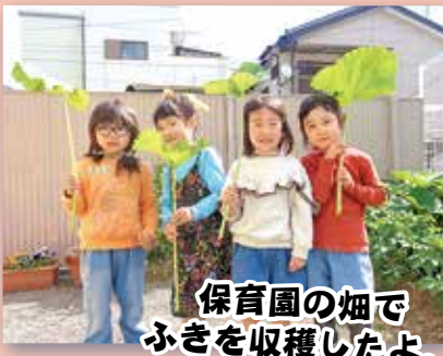
保育園の畑で ふきを収穫したよ。 傘みたいでしょ♡