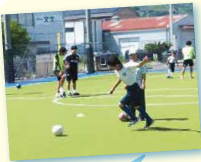
フットサルの招待で、愛仁園のお友だちと交流試合をしたよ。