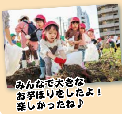
みんなで大きな お芋ほりをしたよ! 楽しかったね♪