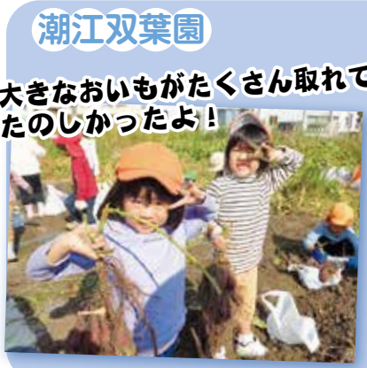
潮江双葉園 大きなおもがたくさん取れて たのしかったよ!