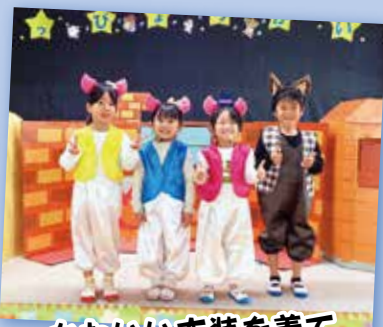
かわいい衣装を着て、 発表会で劇あそびをしたよ!