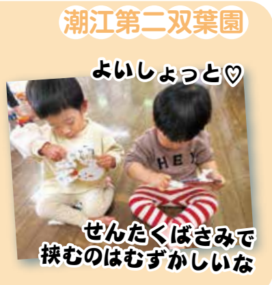
潮江第二双葉園 よいしょっと♡