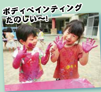
ボディペインティング たのしい〜!