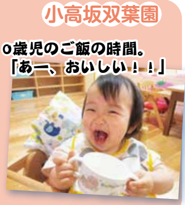
小高坂双葉園 0歳児のご飯の時間。 「あー、おいしい!!」