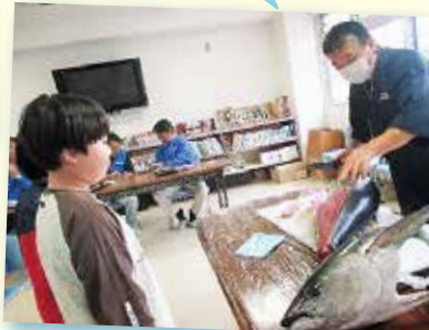
板前さん、カッコいいな～あとで、お寿司いただきます