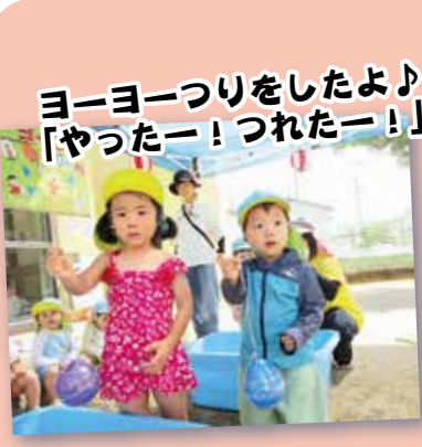
ヨーヨーつりをしたよ♪ 「やったー！つれたー！」