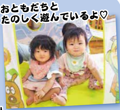
おともだちと たのしく遊んでいるよ♡