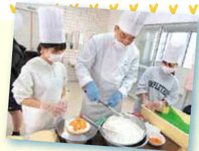
プロのパティシエさんからプロの手ほどき上手にできるかなあ