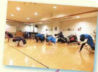
園内のクリスマス会の出し物で、よさこいソーランを踊ったよ。