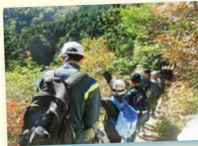
エ石山へハイキングに行ってきたよ。ヤッホー！