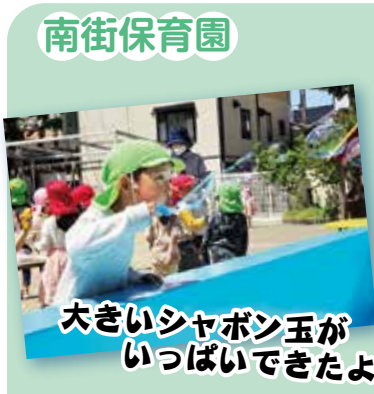
南街保育園 大きいシャボン玉が いっぱいできたよ